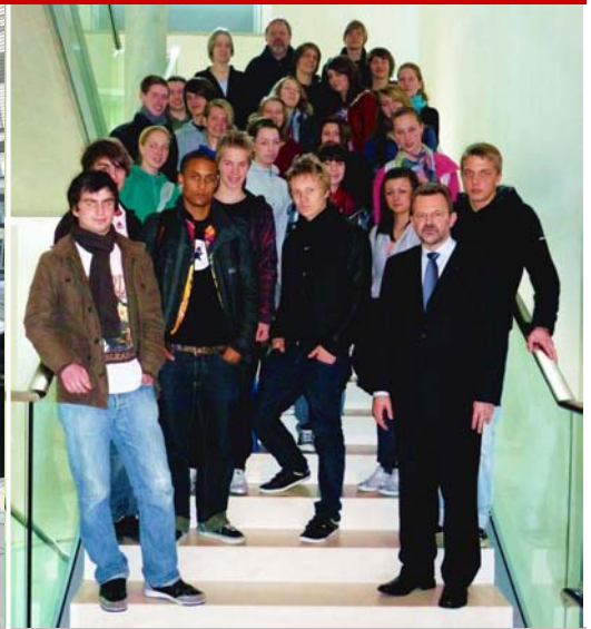
Die 11b des Kreisgymnasiums Bargtheide mit SPD-MdB Franz Thönnnes

Bereits im letzten Thönnnes-Info-Brief hatte Franz Thönnnes auf das große Interesse von Bürgerinnen und Bürgern aufmerksam gemacht, den Deutschen Bundestag zu besuchen. Drei Monate vor der Bundestagswahl ist dieses ungebrochen. Neben Schülergruppen, wie der des Eckhorst Gymnasiums Bargtheide, konnte der SPD-Bundestagsabgeordnete auch wieder eine durch das Presse- und Informationsamt der Bundesregierung organisierte Besuchergruppe in Berlin begrüßen. Thönnnes: „Dass so viele Bürgerinnen und Bürger aus dem Wahlkreis an meiner Arbeit in Berlin interessiert sind freut mich sehr. Es ist ein Zeichen für eine funktionierende Demokratie, wenn das Interesse an den politischen Abläufen so ausgeprägt ist.“