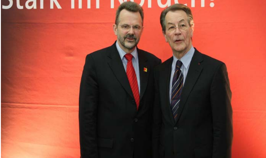
Franz Thönnnes zusammen mit dem SPD-Parteivorsitzenden Franz Müntefering

Die Landeswahlkonferenz der SPD Schleswig-Holstein hat Ende März in Elmshorn ihre Liste für die Bundestagswahl am 27. September 2009 aufgestellt. Die Liste wurde vom Landesvorstand einge-