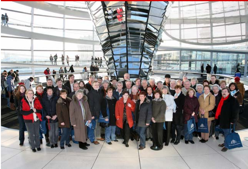
Besuch einer BPA-Besuchergruppe vom 28. bis 30. April 2009