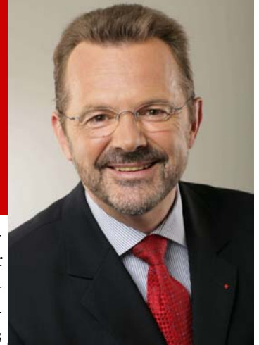
Franz Thönnnes, MdB

Liebe Genossinnen und Genossen, der 29. November 2008 wird mir in guter Erinnerung bleiben. Die 95 Prozent Zustimmung der Delegierten zu meiner Kandidatur für die Bundestagswahl 2009 sind ein „starkes Pfund“. Ich bin mir bewusst, dass mit den 108 Ja-Stimmen von 113 gültigen Stimmen eine hohe Erwartung und auch eine große Verantwortung verbunden ist. Nochmals auch an dieser Stelle ein herzliches Dankeschön für diese großartige Unterstützung, die mich sehr gefreut hat und ebenso bewegt hat. Sie stärkt natürlich ebenso für die vor uns liegende Wahlkampfauseinandersetzung im kommenden Jahr. Da ist noch nichts entschieden. Wir können und müssen aber noch besser werden.