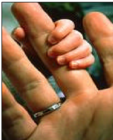
Kleine Menschen brauchen einen starken Halt. Das Elterngeld ist ein Weg dazu.

In skandinavischen Ländern wird Elterngeld seit Jahren erfolgreich praktiziert. In Schweden wird Eltern für insgesamt 480 Tage ein Elterngeld gewährt. 360 Tage davon wird ein Anteil von 80 Prozent des früheren Lohns ausbezahlt. Zusätzlich dürfen die Elternteile ihre Arbeitszeit um bis zu zwei Stunden täglich verkürzen, bis das Kind acht Jahre alt ist, allerdings ohne Lohnausgleich. Die Erhöhung der Geburtenrate in Schweden wird auf diese Praxis zurückgeführt. Auch die Familienarmut wurde durch die Ausbezahlung von Elterngeld gesenkt. In Norwegen haben Eltern Anspruch auf Elterngeld für ein Jahr in Höhe von 80% des früheren Lohns oder alternativ für 42 Wochen zu 100%. In Finnland wird Elterngeld für neun Monate und in Dänemark für mindestens sechs Monate ausbezahlt.