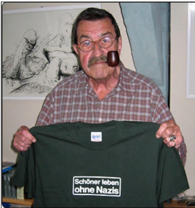
Günter Grass engagiert sich gegen Nazis

Zusätzlich müssen wir Mittel für langfristige Maßnahmen gegen den Rechtsextremismus bereitstellen. Mobile Beratungsteams mit kompetenten Mitarbeiterinnen und Mitarbeitern sollen in Zukunft bundesweit Kommunen und Bürgerinitiativen gegen Rechts beraten und unterstützen. Über Netzwerkstellen sollen engagierte Menschen zusammenarbeiten und Opferberatungen präventiv und im konkreten Einzel-